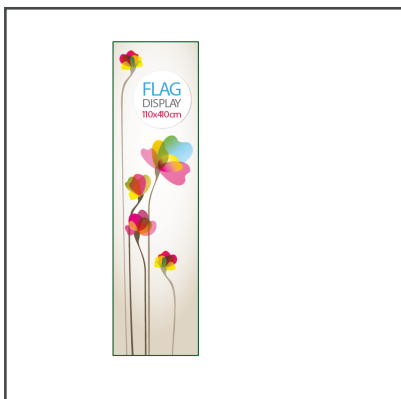
Fișier corect (doar grafică și bleeduri, neredimensionat).